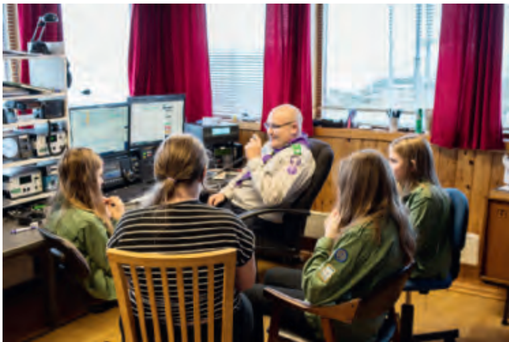
En gruppe KM-speidere fikk kontakt med en speider i Philadelphia, USA.

JOTA-JOTI 2018 på Karmøy ble i år større enn noen gang. 131 speidere, 16 rovere og 36 ledere fra åtte av øyas speidergrupper på felles JOTA-JOTI arrangement i Åkrehamn, med god støtte fra foreldre, Speidernes Beredskapsgruppe og Haugalandgruppen av NRRL.